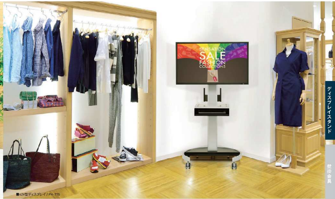
■42V型ディスプレイ / PH-775 (棚板は取り外した状態です)