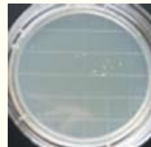
石けんで洗った指

手洗いが不十分だと雑菌等の温床となり、二次汚染につながる可能性が高いため要注意！