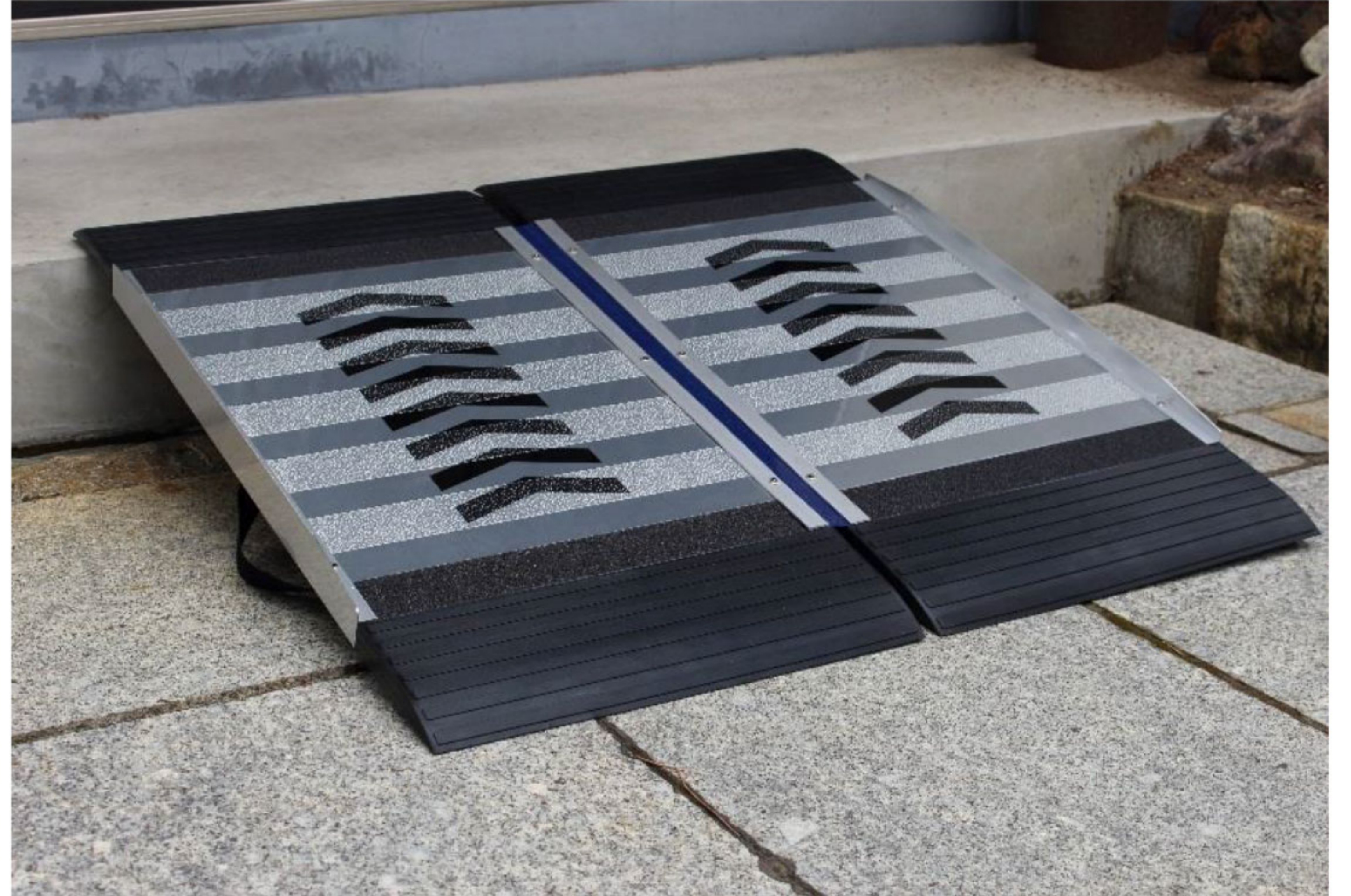
※JR浜松町駅にて実用試験中