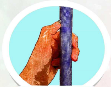
押しやすいボタン

カラーゴムチップにカラーシャフトのおしゃれ杖 高反射素材で車などのライトに強く反射し ドライバーに発見されやすく安全性が向上 大型ボタンで伸縮操作も楽々