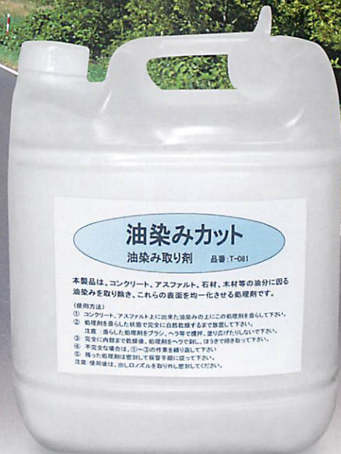
T-081 NET.Wt. 4.8kg

コンクリート、アスファルト、石材、木材等の油分に因る油染みを取り除き、これらの表面を均一化させる処理剤です。