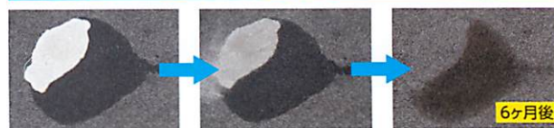
油圧オイルの染み跡処理。

エコエストジャパン株式会社 大阪府守口市寺方元町3-4-10 TEL: 06-6992-3313 FAX: 06-6992-3358 URL: http://www.ecoestjapan.co.jp