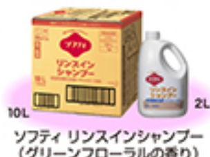
ソフティ リンスインシャンプー (グリーンフローラルの香り)