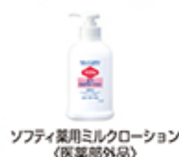
ソフティ薬用ミルクローション (医薬部外品)