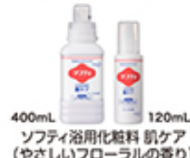
ソフティ浴用化粧料 肌ケア (やさしいフローラルの香り)