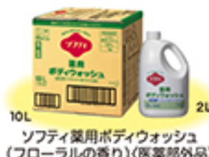
ソフティ薬用ボディウォッシュ (フローラルの香り)(医薬部外品)