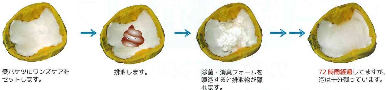
受バケツにワンズケアをセットします。