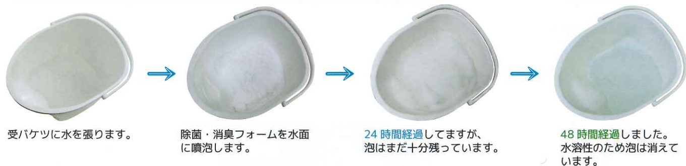
受バケツに水を張ります。