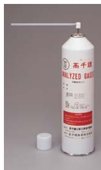
校正用CO/CO 2 ガス ブッシュ缶 1508

センサは、月日の経過や環境の変化により感度変化を生じることがあります。正確な測定を行うためには、校正用ガスによる校正が必要になります。