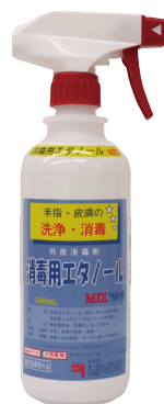
スプレー装着時の写真