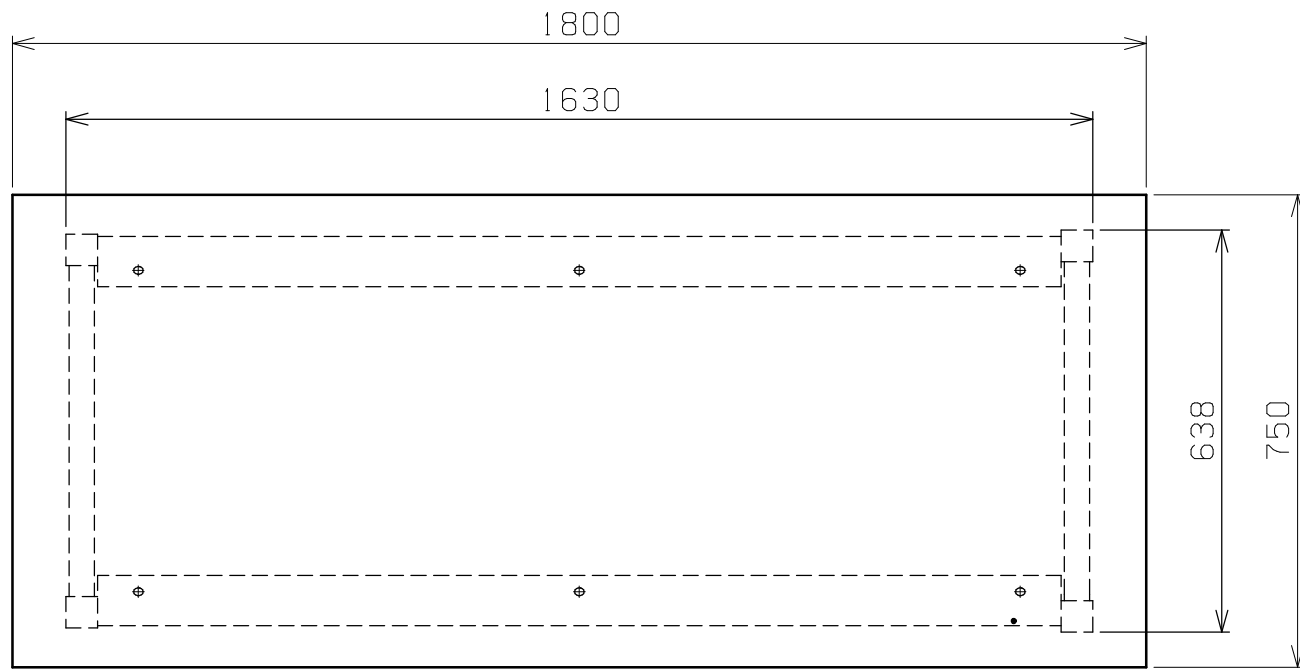
天板・塗装色と品番の関係