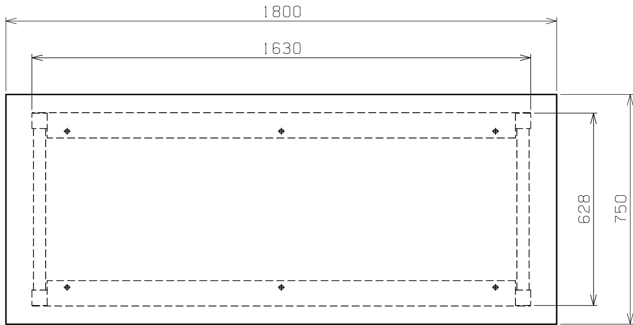
天板・塗装色と品番の関係