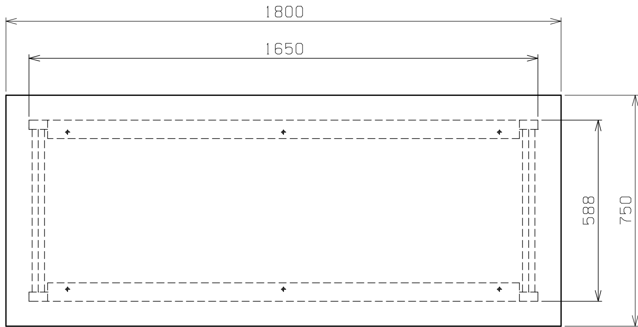
天板・塗装色と品番の関係