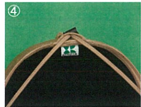
④ループとドロコードで固定