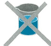
シンナー・ベンジン・塩酸・強アルカリ薬品の使用禁止