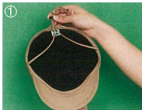
①あごひもを帽子の後ろ側へ