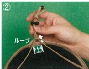
②あごひもを下からループへ通す