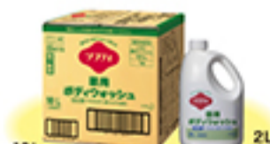
10L ソフティ薬用ボディウォッシュ (フローラルの香り)(医薬部外品)