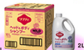
10L ソフティヘッド&ボディシャンプー MILD(マイルド、微香性) (フレッシュフローラルの香り)