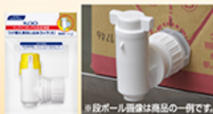
※段ボール箱は商品の一例です。

別売りの「ソフティ用アプリケーションシャンプー 1000mL(つめかえ空容器)」をご利用ください。