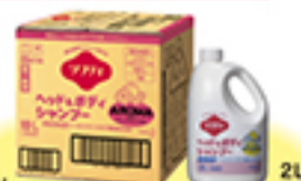
10L ソフティヘッド&ボディシャンプー AROMA(アロマ) (グレープフルーツの香り)