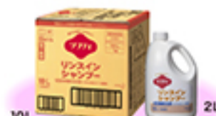
10L ソフティリンスインシャンプー (グリーンフローラルの香り)