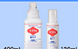
400mL 120mL ソフティ浴用化粧料 肌ケア (やさしいフローラルの香り)