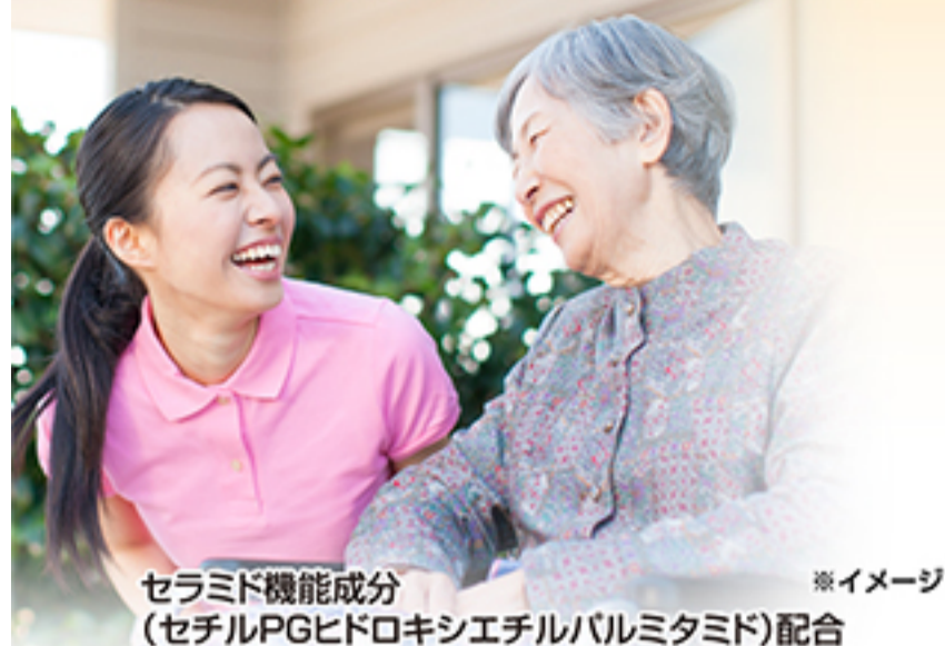
セラミド機能成分 (セチルPGヒドロキシエチルパルミタミド)配合