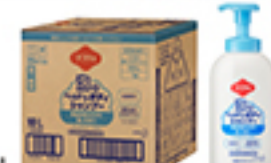
10L ソフティ泡のヘッド&ボディシャンプー (フローラルグリーンの香り)

別売りの「ソフティ泡のヘッド&ボディシャンプー用アプリケーション 700mL(つめかえ容器)」をご利用ください。