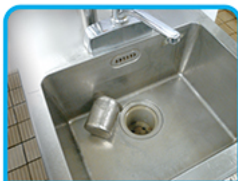
厨房シンクの排水口に