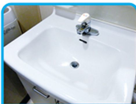
宿泊・温泉施設の 洗面台・浴室に