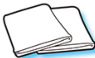
●ふきん (色柄物も可)