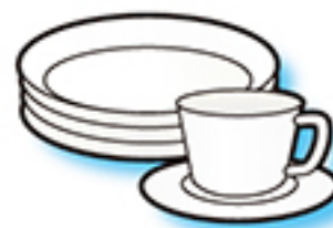
●食器 (メラミン食器も可)