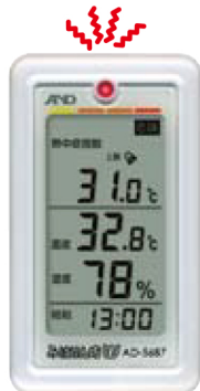
(熱中症指数の表示例)