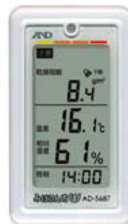
(乾燥指数の表示例)