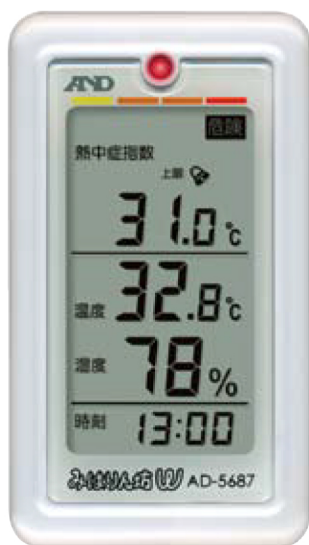
(熱中症指数の表示例)