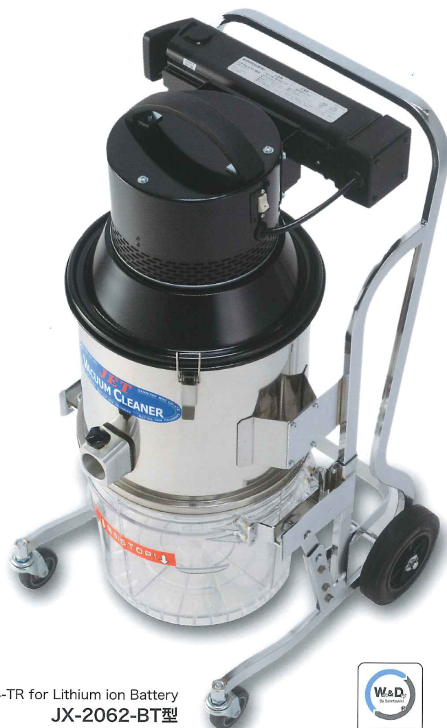
Ver.4-TR for Lithium ion Battery JX-2062-BT型

(乾式・湿式の区別なく粉も液体も自由自在に同時吸引できます) 乾式フィルターの着脱による使い分けがありません 特許「ハイブリッドシステム」搭載JX-2060のコードレスタイプです