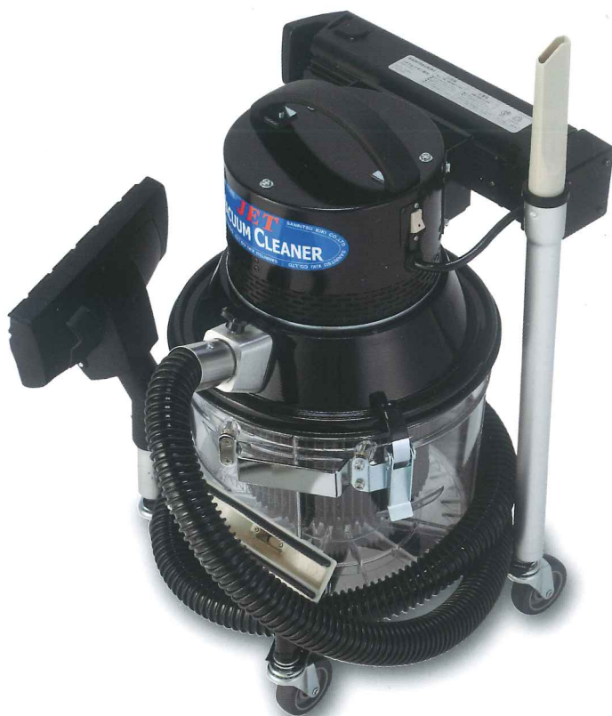
Semipro-vac for Lithium ion Battery Sp-1512-BT型

(乾式フィルターの着脱で乾いたゴミと液体の使い分け) 評判の「セミプロバック」Sp-1510のコードレスタイプです アタッチメント収納台車付