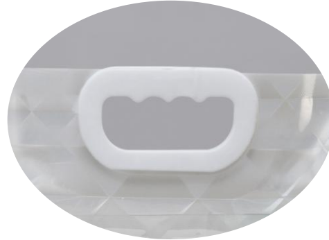
肉厚の持ち手で手が痛くなりにくい