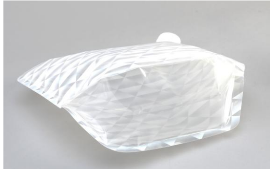
底マチがあり、自立します