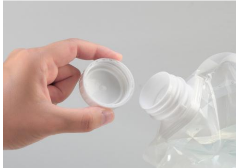
35mm口径で注水も簡単です