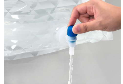
回転水栓付きで吐水も楽です(12L)