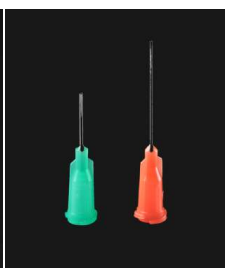
プラスチック基ニードル PNG-□□ 針材質：SUS304 針基材質：PP