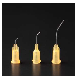
プラスチック曲げニードル BNG-□□ 針材質：SUS304 針基材質：PP