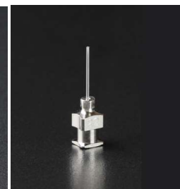
金属基ニードル KNG-□□ 針材質：SUS304 針基材質：黄銅Ni