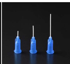
樹脂ニードル JNG-□□ 針材質：PTFE 針基材質：PP