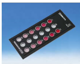
樹脂比色板 DPD 法用