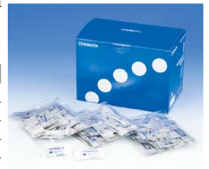
粉体試薬 DPD 法 徳用 （500 回分）