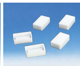
シリコンキャップ （角形試験管用）