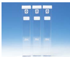
角形試験管 シリコンキャップ付