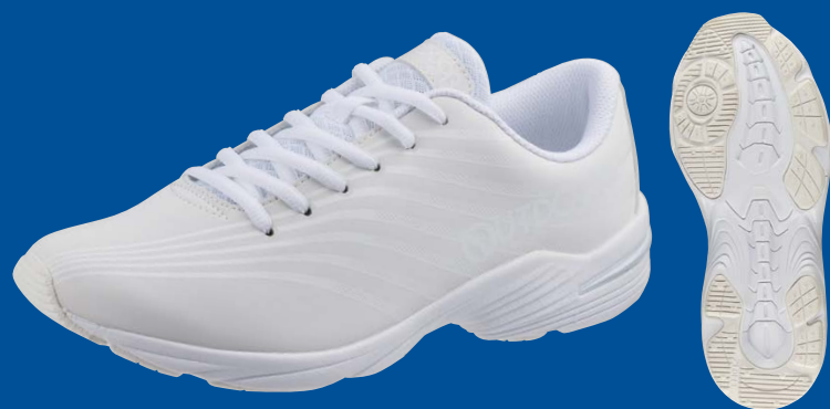
ホワイト/ホワイト KE77023