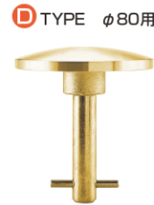
D TYPE φ80用