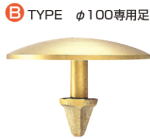
B TYPE φ100専用足