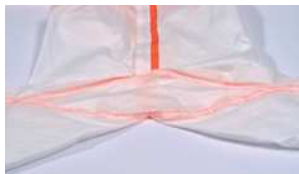
しゃがんだ作業が楽になる股マチ