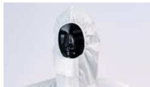
密閉性を向上させたフード

お客様の声を反映させ、動きやすさをサポートする「Active仕様」を取り入れました。