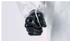
袖のずり上がりを防ぐ指ゴム