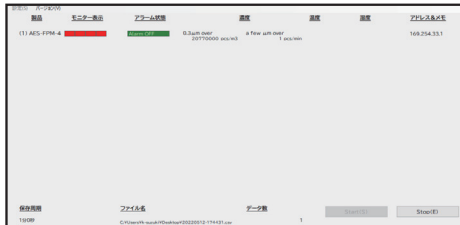
測定中画面（メイン画面）