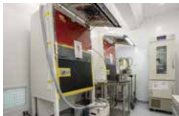
二酸化塩素ガス分解