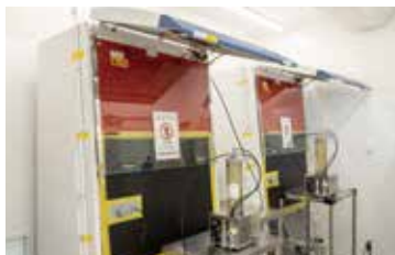
二酸化塩素ガス発生