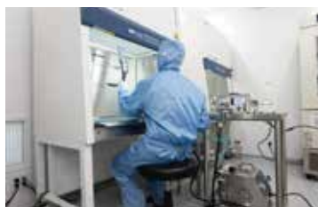
フィルター透過率検査

安全キャビネットに求められる性能を規格に基づいて検査します。(NSF/ANSI49、JIS K3800等) ・風速検査(吹出し風速・流入風速) ・フィルター透過率検査