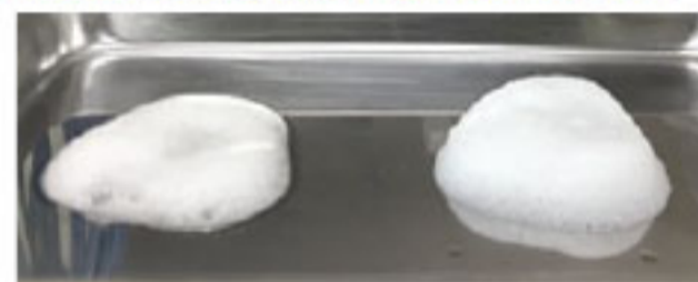
一般的な油汚れ用洗剤