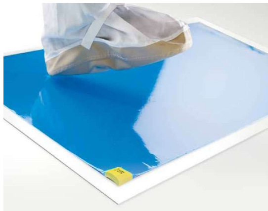
青のマットと 白フレーム

CleanStep™粘着マットは、クリーンルームの作業エリアに入る前に人の往来によって汚染される粒子状物質を除去します。CleanStep™のラインアップには様々なサイズや色の粘着マットがあります。