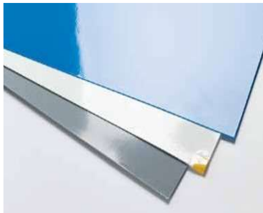
グレー、青、白 クリーンルームマット