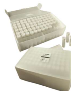
TX3350 & TX3350C