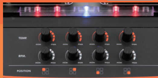
アナログタイプ操作パネル・安全ランプ (LSH-4A)