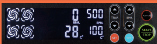
デジタルタイプ 操作パネル (LSH-4D)