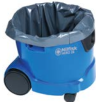
プラスチックバッグ (オプション)