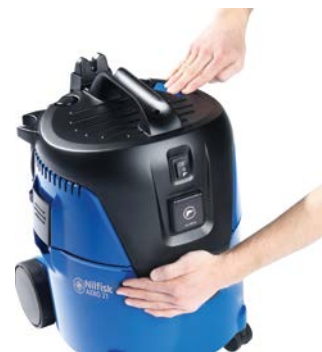
吸気口を塞ぎボタンを押すだけ